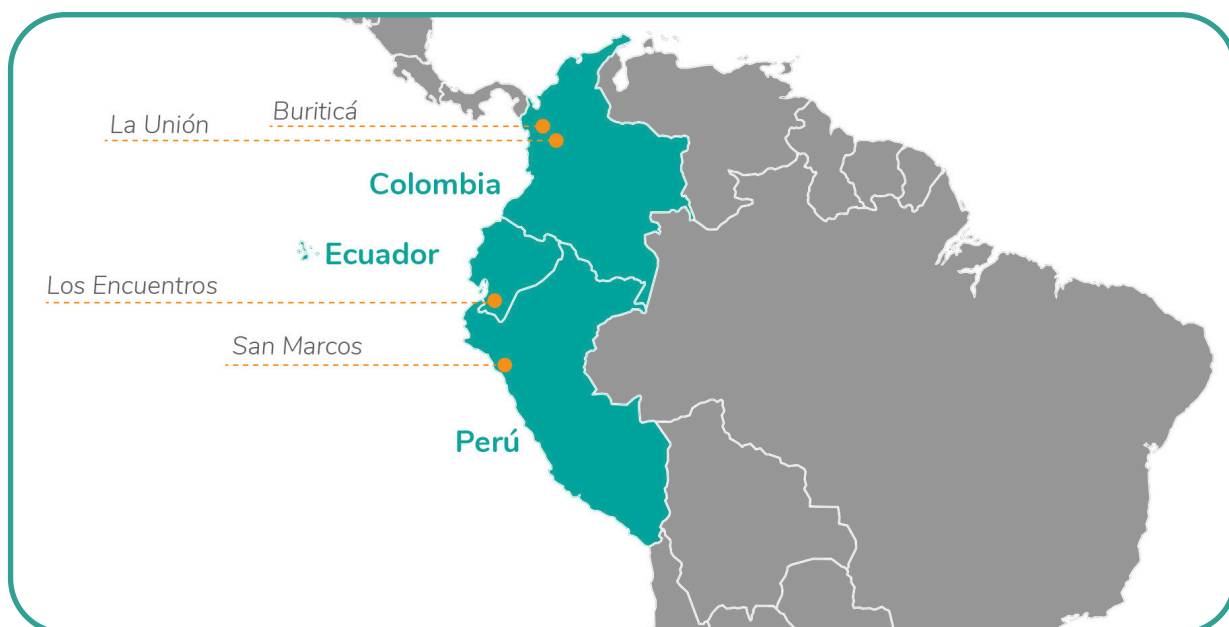
Oficinas permanentes y OTTs en Latino América

contamos con observatorios y equipos especializados en Ecuador, Colombia y Perú, que están poniendo en práctica todas las metodologías desarrolladas en los módulos .